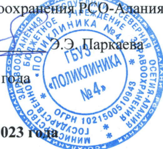
ГРАФИК работы в нерабочий праздничный день 8 марта 2023 года